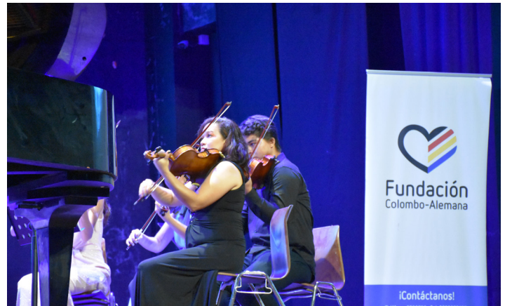
Concierto en el Auditorio del Colegio Alemán.

Las mascotas cada día juegan un papel fundamental en nuestra sociedad, pueden disminuir el estrés, mejorar la salud del corazón e, incluso, ayudar a los niños