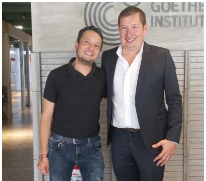
Estrategias relacionamiento FCAB con el Goethe-Institut Kolumbien durante el 2022.