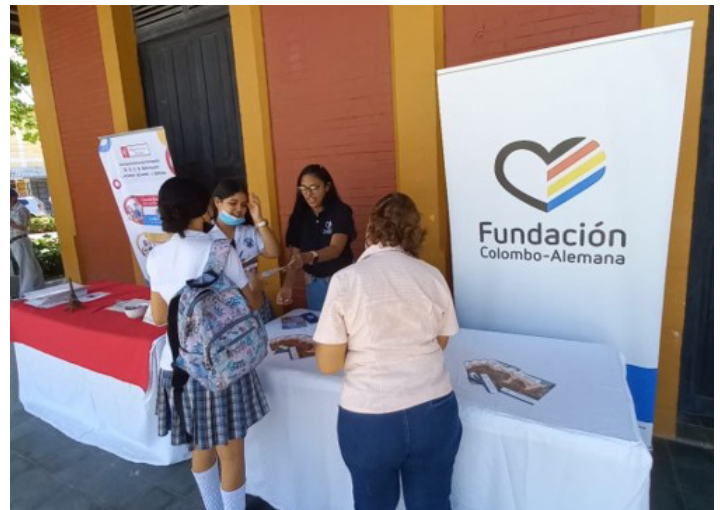
Estrategias de posicionamiento de la FCAB.