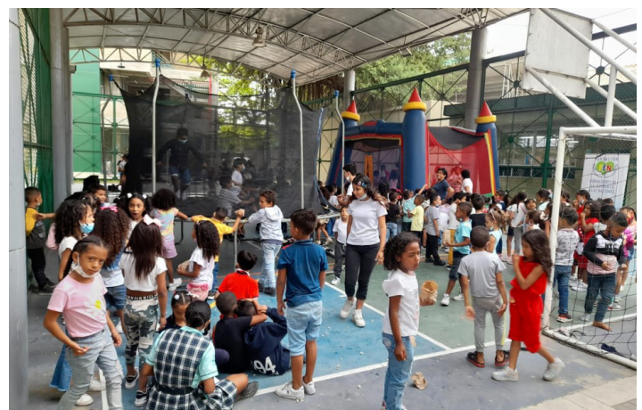
Actividad del Perfil Social de la FCAB.