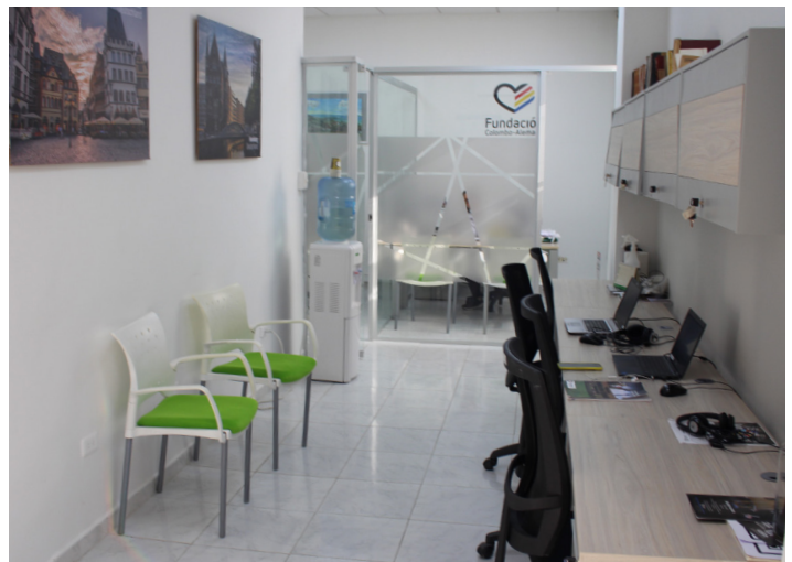
Nueva oficina de la Fundación Colombo-Alemana.