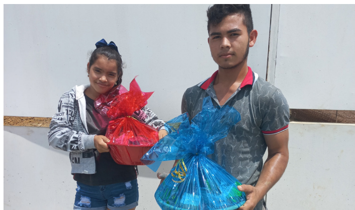
Donaciones a la comunidad de la Vereda Las Nubes.