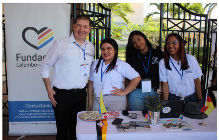
El Equipo FCAB durante el Reencuentro de Exalumnos.